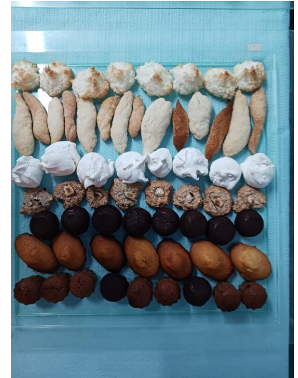
Une toute petite partie du buffet