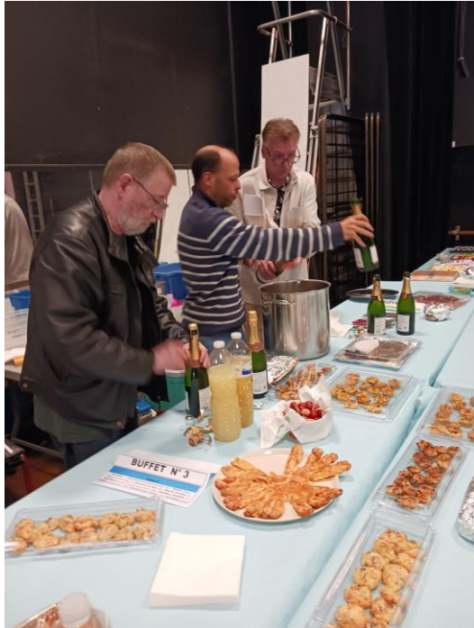
La préparation du cocktail, le moment décisif